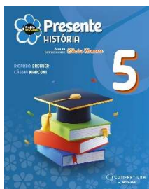
Projeto Presente - História - 5º ano - 6ª Edição - Editora Moderna