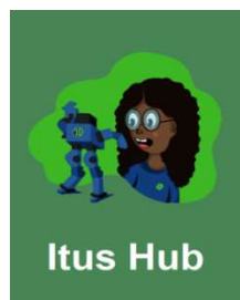
Plataforma de conteúdos online ITUS HUB - Informática - 5º ano