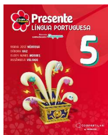
Projeto Presente - Português - 5º ano - 6ª Edição - Editora Moderna