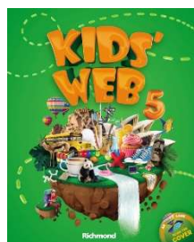
Kids' Web 5 - 3ª Edição - Editora Richmond