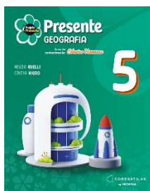
Projeto Presente - Geografia - 5º ano - 6ª Edição - Editora Moderna

Obs.: este item deve ser adquirido no estabelecimento de sua preferência.