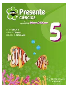
Projeto Presente - Ciências - 5º ano - 6ª Edição - Editora Moderna