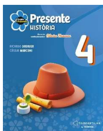
Projeto Presente - História - 4º ano - 6ª Edição - Editora Moderna