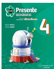
Projeto Presente - Geografia - 4º ano - 6ª Edição - Editora Moderna

Obs.: este item deve ser adquirido no estabelecimento de sua preferência.