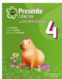
Projeto Presente - Ciências - 4º ano - 6ª Edição - Editora Moderna