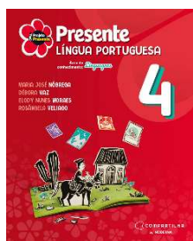
Projeto Presente - Português - 4º ano - 6ª Edição - Editora Moderna