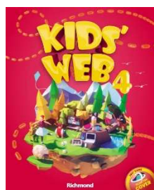
Kids' Web 4 - 3ª Edição - Editora Richmond