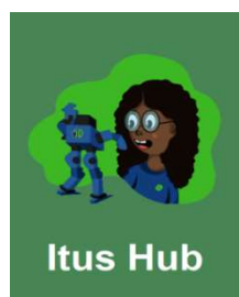
Plataforma de conteúdos online ITUS HUB - Informática - 3º ano