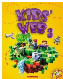
Kids' Web 3 - 3ª Edição - Editora Richmond