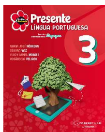
Projeto Presente - Português - 3º ano - 6ª Edição - Editora Moderna