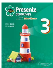
Projeto Presente - Geografia - 3º ano - 6ª Edição - Editora Moderna

Obs.: este item deve ser adquirido no estabelecimento de sua preferência.