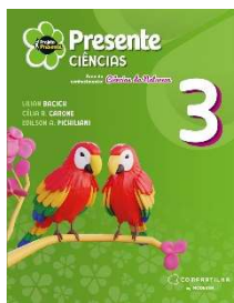
Projeto Presente - Ciências - 3º ano - 6ª Edição - Editora Moderna