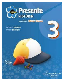
Projeto Presente - História - 3º ano - 6ª Edição - 9788552724438